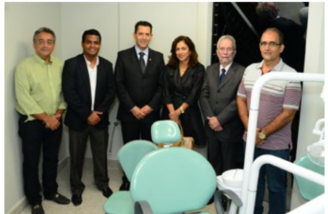
Equipe Sesi Odontovida e ABIGRAF-MG/SIGEMG inauguram os consultórios

Os dados sobre saúde oral no Brasil são preocupantes. De acordo com o Levantamento Nacional de Saúde Bucal, 20% da população nunca foi ao dentista e 98% dos brasileiros têm ou já tiveram doenças periodontais, como cáries, inflamação da gengiva e perda dental. Problemas que afetam diretamente o bem-estar das pessoas, afinal, uma boa saúde começa essencialmente pela boca.