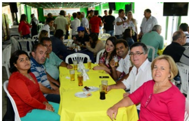
Familiares também garantiram presença no churrasco