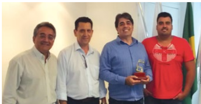
A Rede Editora foi uma das agraciadas com o Prêmio Fernando Pini

"GANHAR O PINI NOS DÁ SEGURANÇA PARA BUSCAR OUTRAS PREMIAÇÕES PARA QUE NOS DÊ MAIS VISIBILIDADE NO MERCADO."