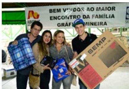
Foram sorteados brindes para os participantes